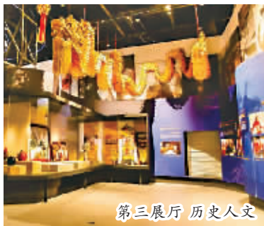
第三展厅 历史人文