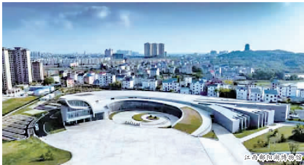
江西鄱阳湖博物馆

博物馆是一座城市的文化殿堂，是滋润着一座城市精神的文化源泉。它由中国建筑设计研究院设计建造，以“百鸟朝凤”为设计理念，表现了鄱阳湖作为候鸟天堂的自然属性。五条非常漂亮