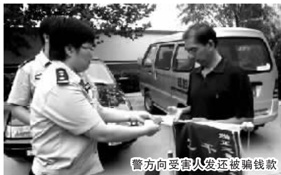
警方向受害人发还被骗钱款