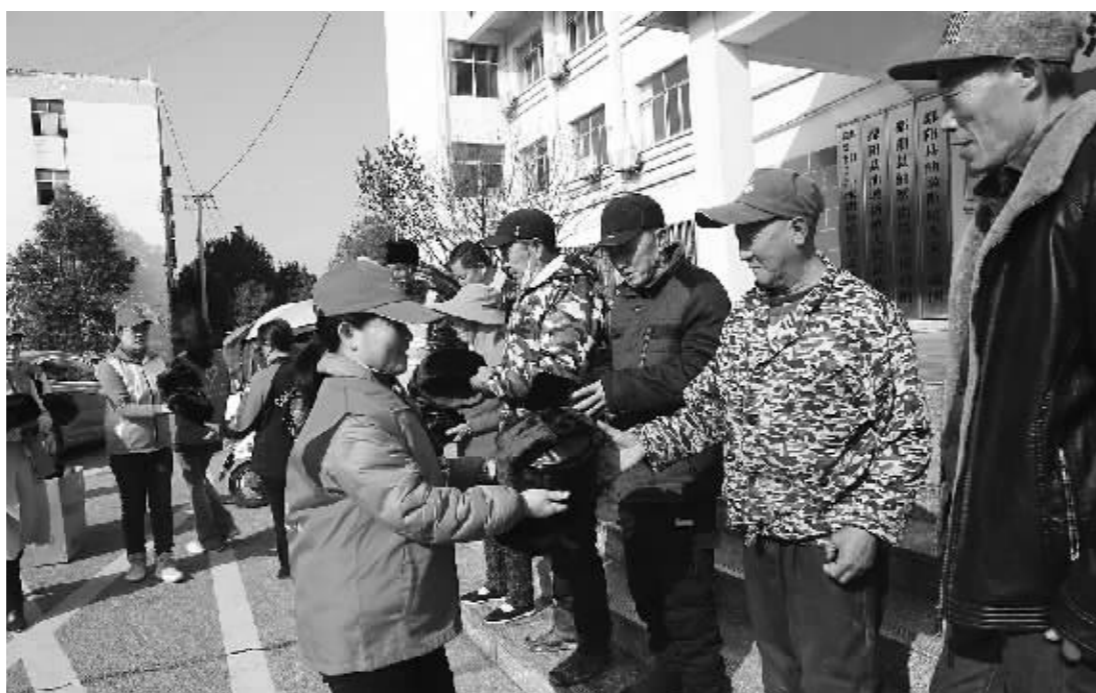
近日,鄱阳县志愿者协会油墩街分会开展“助力创卫城、关爱环卫工人”送温暖活动,志愿者及爱心企业为镇区28名“城市美容师”每人准备了一顶绒帽,一份汉堡、小吃、热饮,感谢他们为美丽集镇文明卫生创建作出贡献。

余干讯 “以前去古埠镇赶集,需要很长的时间,村民办事也特别不方便。现在建好了青岭大桥,出行非常方便,群众日子定会越来越红火。”余干县古埠镇邱家村村民段思义高兴地说。青岭大桥建成是余干县交通运输局聚焦民生办实事、优化交通暖民心的真实写照。 如何实现群众出行条件从“走得了”向“走得好”转变?余干县交通运输局精心谋划,认真组织,紧盯目标任务,狠抓工作落实,按照“目标任务化、任务项目化、项目责任化”要求,率先在全市完成20道渡口撤销任务,并通过客运替代、撤渡建桥、撤渡通路等方式切实解决了沿岸群众出行难问题。截至目前,共投资16731万元,实施(村)道路改造提升、生命安全防护等工程项目191.9公里。 坚持推进“客货邮”融合发展。在余干通往康山的道路上,客运汽车来回穿梭,既满足了群众便捷出行,又有效解决了农村物流末端配送成本高难点问题。该局大力推行的“客运+货运+邮运”模式,着力打通农村地区群众出行、货运物流、快递服务“最后一公里”。同时启动余干至康山、余干至东塘两条“客货邮”合作线路,进一步节约运输资源,提升运输效率,实现资源整合、优势互补、融合发展,为服务乡村振兴提供强有力的交通运输保障。(韩海建)