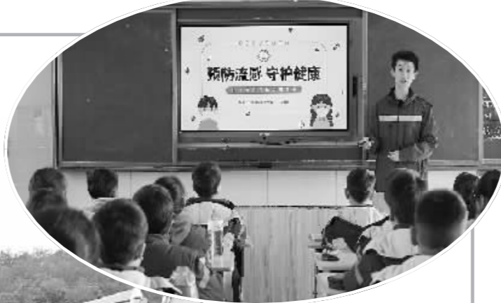
眼下正是呼吸道疾病的高发期,近日,横峰县疾控中心工作人员在横峰实验小学、绿康岑阳家园等地,宣传如何预防秋冬季流感等病毒,引导他们做好呼吸道疾病的防控和疫苗的接种,全力保障“一老一小”冬春季的健康。