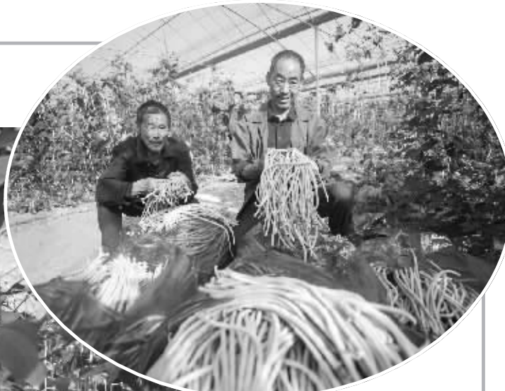
11月17日,广丰区排山镇卅八都村蔬菜种植专业合作社的豇豆喜获丰收,农民忙着采摘供应市场。