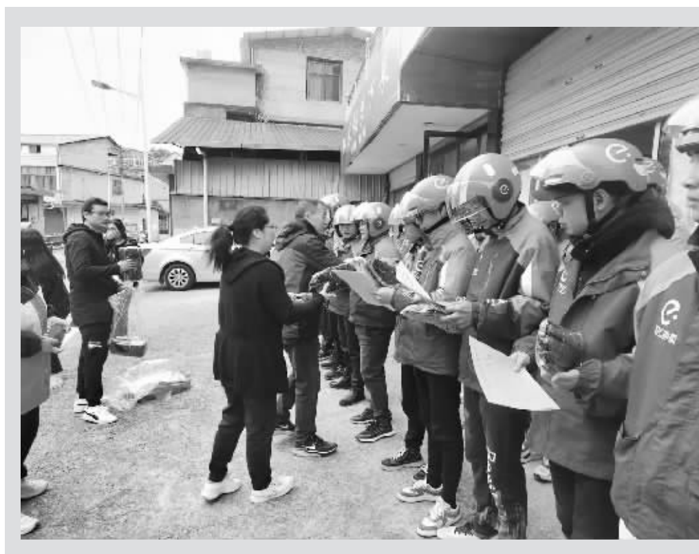
近日,铅山县总工会举行2023年“新就业形态劳动者温暖服务季”启动仪式暨法律宣传活动。此次活动重点面向新就业形态劳动者,聚焦快递员、外卖配送员、网约车司机、货车司机等群体,旨在进一步推动健全完善新就业形态劳动者权益保障机制,在全社会营造尊重关爱新就业形态劳动者的良好氛围。

“正是有无数像方志敏这样有着崇高信仰的革命志士,才有了我们国家如今的繁荣昌盛。我们要常怀感恩之心,清楚认识幸福来之不易,感念建党建国之艰辛,时刻缅怀革命先辈抛头颅、洒热血的英雄气概,继承他们的革命信仰,也要用我们的方式肩负起属于我们这一代人的责任与担当。”听完宣讲后,在场官兵纷纷表示,要把学习方志敏革命精神与学习贯彻党的二十大精神相结合,锚定建军一百年奋斗目标,自觉肩负起强军兴军的伟大使命,为打造能征善战的精兵劲旅贡献力量。