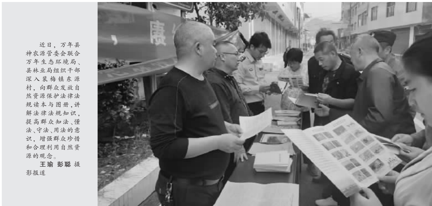
近日,万年县神农管委会联合万年生态环境局、县林业局组织干部深入裴梅镇东源村,向群众发放自然资源保护法律法规读本与图册,讲解法律法规知识,提高群众知法、懂法、守法、用法的意识,增强群众珍惜和合理利用自然资源的观念。 彭聪 报道

据悉,为了做好粮食安全和反餐饮浪费工作,该区总工会和农业农村局通过强化宣传、教育引导、纠树并举等措施,积极引导广大干部职工养成珍惜粮食、理性用餐、节约用餐的好习惯,主动抵制舌尖上的浪费”。