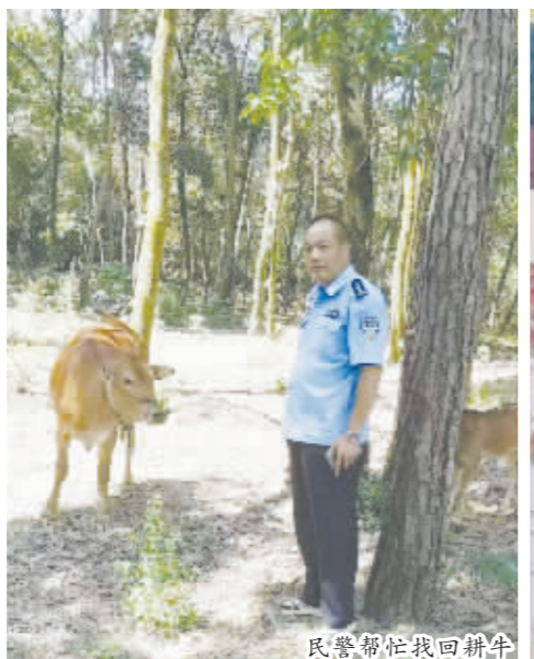
民警帮忙找回耕牛

民警顾不上炎热,同龟峰景区工作人员迅速穿上防护服,戴上口罩,用防蜂喷雾剂对准蜂窝出入口喷射,直至将蜂窝里的马蜂杀死,成功将该马蜂窝铲除,并将地上残余的马蜂悉数清理。此举保障了游客的旅行安全,为龟峰景区消除了安全隐患。