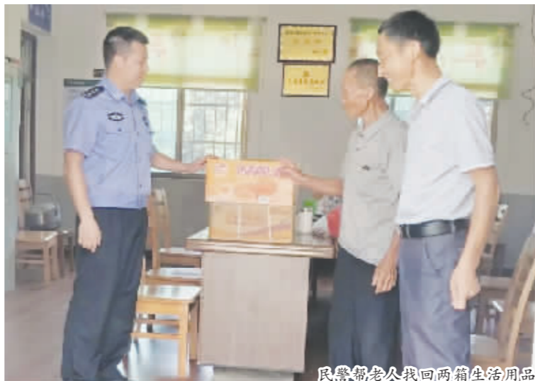
民警帮老人找回两箱生活用品