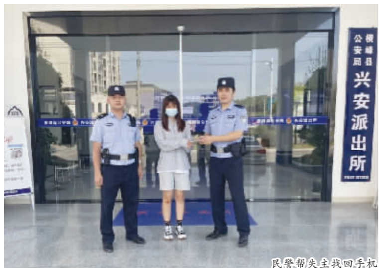
民警帮失主找回手机