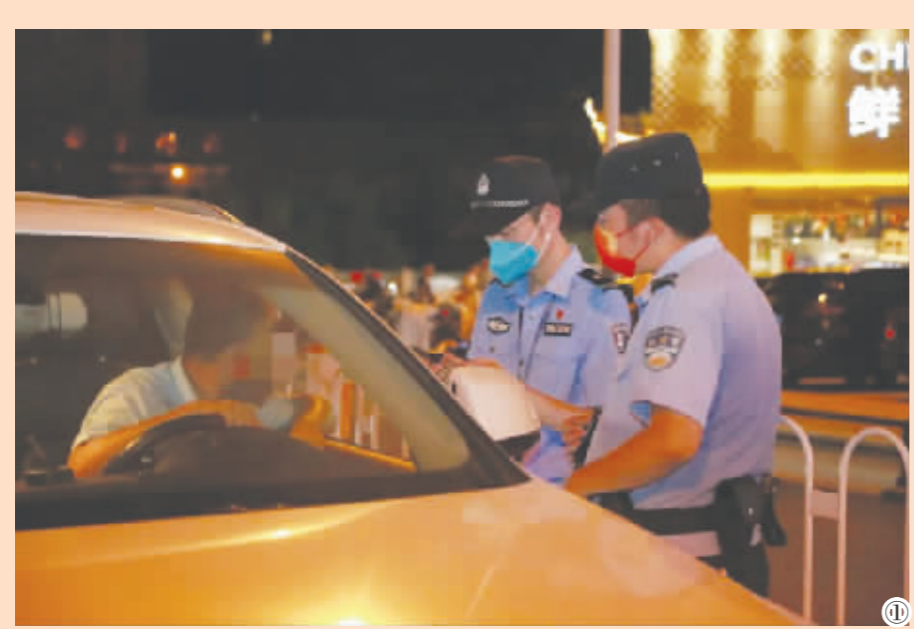
①民警上路查酒驾 ②民警深夜河边巡逻 ③民警到辖区旅店检查