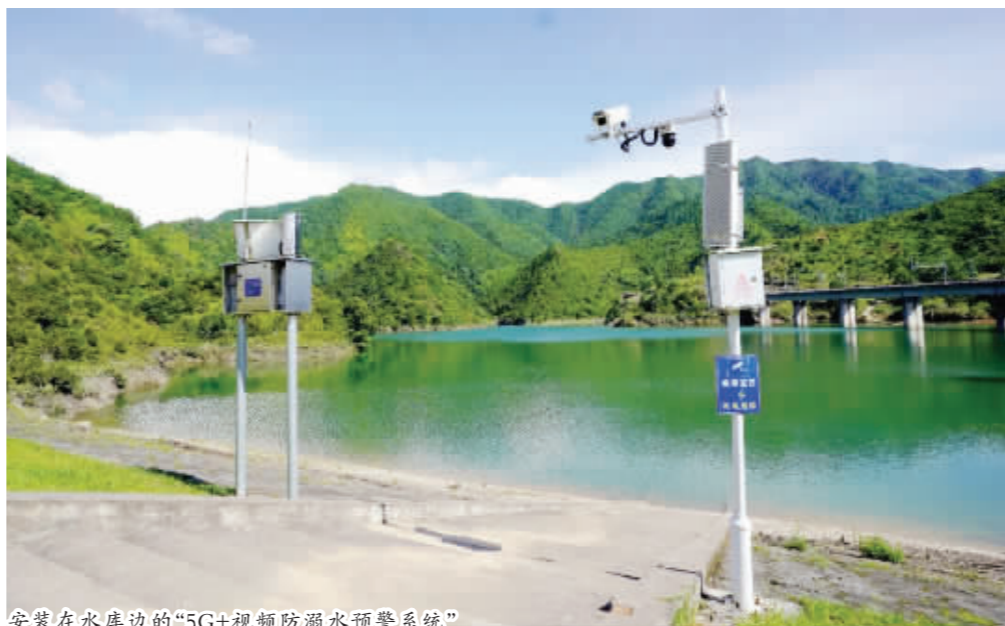
安装在水库边的“5G+视频防溺水预警系统”

“群众都很配合,效果很好!听到系统喊话,一般都会自觉离开,不会冒险下水,实在有不听语音劝阻的,我们立即人工喊话。”负责参与系统管理的临湖派出所民警说。今年以来,临湖镇