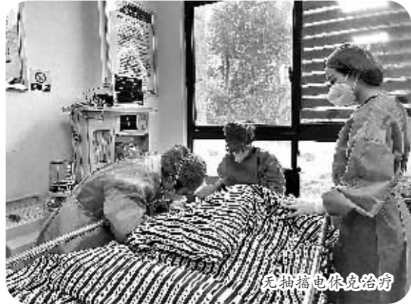
为患者做电休克治疗