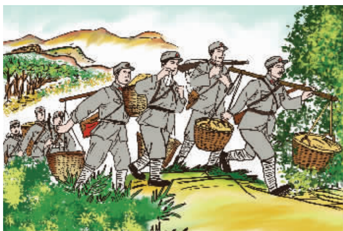
红色管家不好当 ——管理有方的省苏财政部长