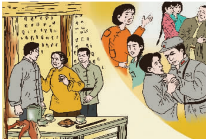
红军的纪律是铁打的 ——穷人的队伍绝不允许欺压百姓