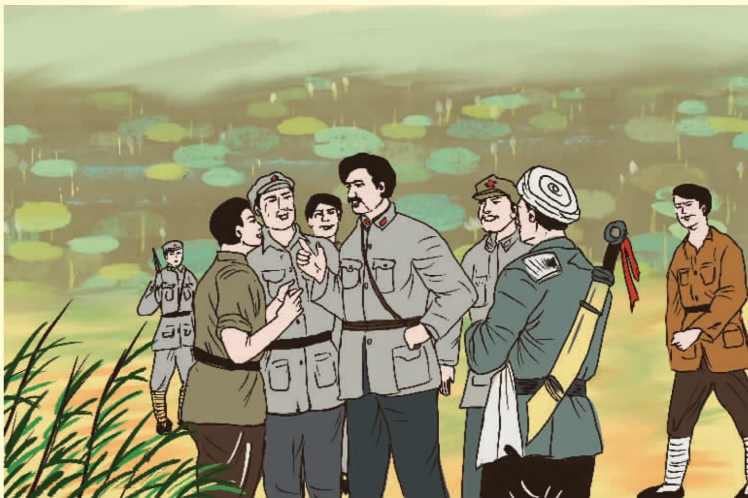
把农民兄弟放在心上 ——方志敏、邵式平贴情