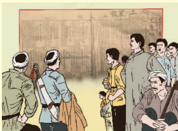
震慑鬼魅的展览会 ——方志敏铁腕治腐败