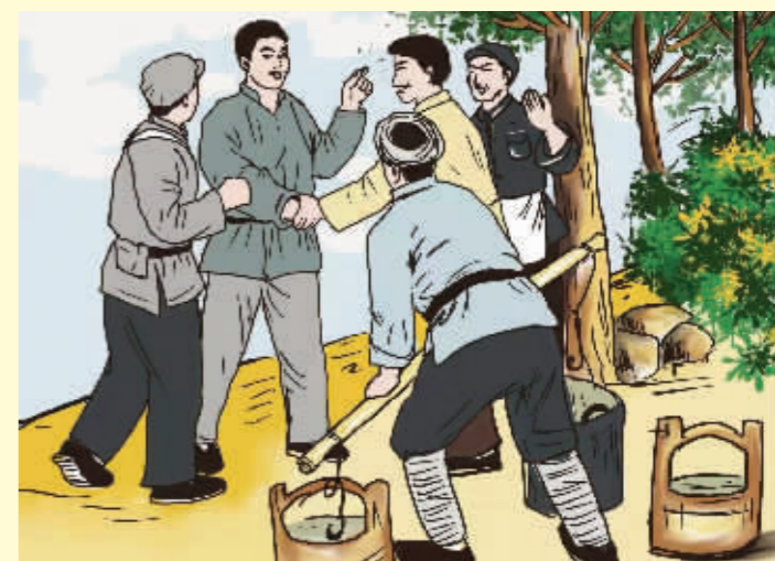
一块银元 ——方主席的洗衣费