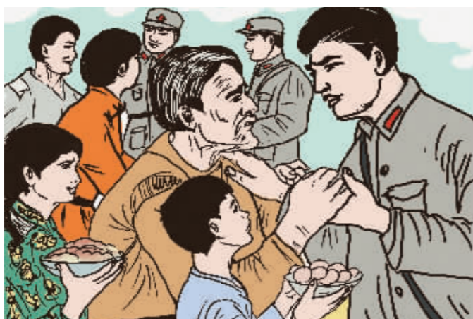
不能白吃一顿饭 ——邵式平带兵纪律严明