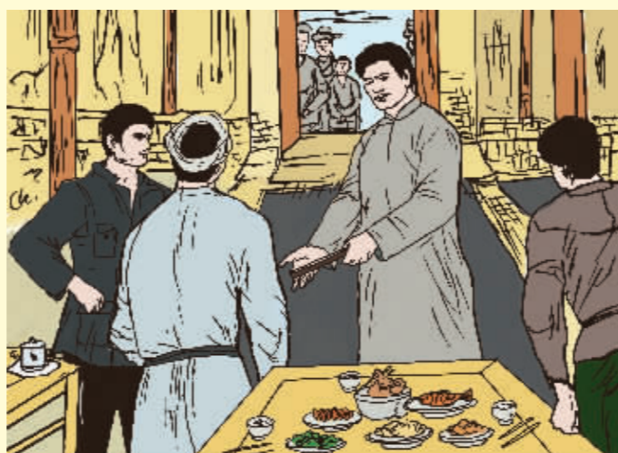
方志敏不吃特殊饭 ——小小细节显风范