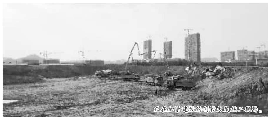
正在加紧建设的创投大厦施工现场。

2月7日上午,记者乘车沿着信江河向西行驶,来到合口北路与中心大道交汇处,只见数台自卸车和挖掘机正在忙碌作业,建设现场一派火热景象。“这是创投大厦项目,正在进行基坑开挖施工。”据项目施工负责人介绍,创投大厦项目总投资16.8亿元,占地90亩,总建筑面积约22万平方米,由三栋建筑物组成,分别为信江之窗、人才中心、便民服务中心,其中信江之窗高166米,将成为上饶经开区的“地标”。