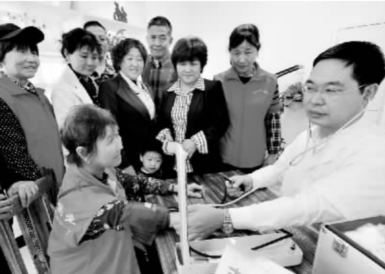
11月17日,在鄱阳县饶城街道山水天下社区居家养老服务中心的社区诊所里,几位老大娘正在做血压检测。据了解,这是该社区为方便辖区300余位60岁以上老人就医专门开设的一家诊所,聘请了7名医务人员轮流值班,保证每天都有医生坐诊。社区医院的开设,不仅方便了老人和子女,同时也提升了社区居民的生活质量,受到了广大社区居民的欢迎。

希望。然而,我们知道,打拐工作任重道远。就在此刻,仍有不少被拐儿童尚未被找回,仍有人贩子正将罪恶的魔爪伸向更多的受害者,那个被全民通缉的“梅姨”依然逍遥法外。 孩子是家长的宝贝,是家庭的未来。一个孩子的被拐,一个家庭的“天”也塌了。加大对人贩子的打击力度,再怎么强调都不为过。我们期待真正的“梅姨”早日落网,也期待通过全社会的共同努力,让“天下无拐”成为美好现实。 (黄磊)