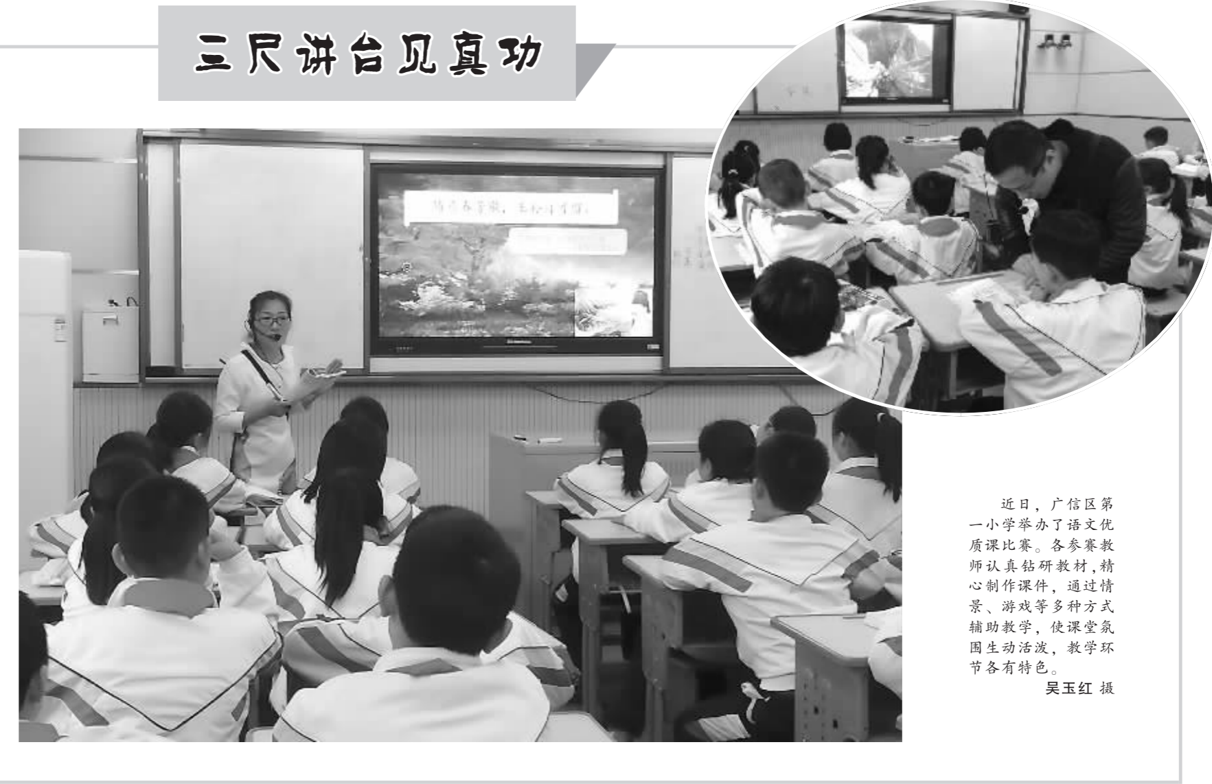
近日,广信区第一小学举办了语文优质课比赛。各参赛教师认真钻研教材,精心制作课件,通过情景、游戏等多种方式辅助教学,使课堂氛围生动活泼,教学环节各有特色。

“第三是做好为民服务文章。”吴曙说,县委加强党建引领,着力通过主题教育整改来为民生事业解难题、补短板;以“党建+老年幸福食堂”为抓手,全面加强农村养老服务体系建设,全县老年“幸福食堂”已建成投入使用41家,覆盖四分之一的行政村,有效缓解了农村养老难题;以“党建+”理念引领政务服务工作新发展,各部门围绕“一次不跑”、“只跑一次”政务服务改革,提高办事效率,优化实体经济发展环境。全县业务审批时限缩短50%以上,少数事项缩短85%;所有“一次不跑”涉税事项均实现电子税务局一网通办,90%以上涉税业务已实现一次办理。通过解决一件件的操心事、烦心事、揪心事,切实增强了群众的获得感、幸福感、安全感。