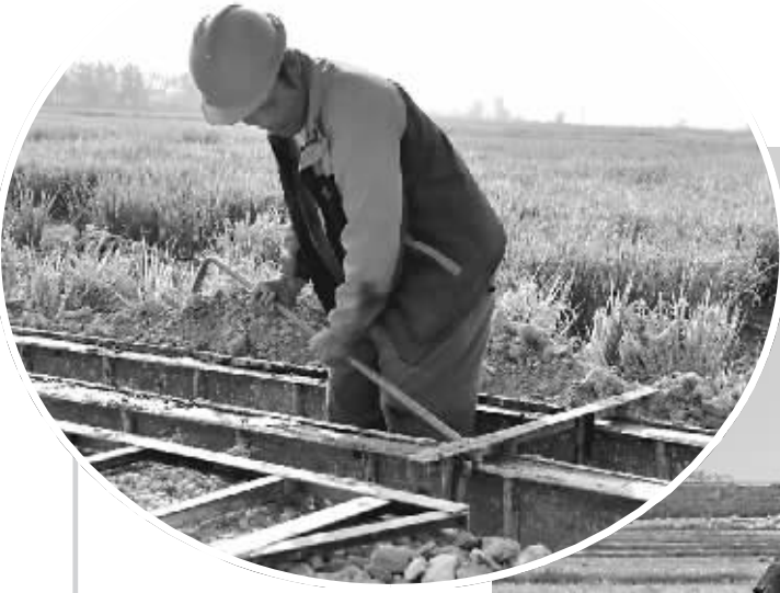
11月12日,鄱阳县双港桥下村农民抢抓晴好天气,抢修水渠。眼下正是兴修水利的大好时节,鄱阳湖区农民抢抓时机进行施工,在初冬之时掀起冬修水利的热潮。

为进一步加强森林资源管理工作,2019年,德兴市林业局与江西联通公司合作开发了林长通APP,并分期分批对各级林长、监督员和护林员进行专业培训。通过林长通APP实现网格化分级管理,推行林长通APP,有效掌握护林员巡山管护情况,做到巡山护林、事件上报、事件处置、巡查统计管理在第一时间完成,实现护林管理科学化。(余江林)