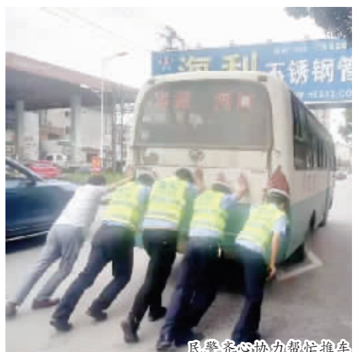
民警齐心协力帮忙推车

正当司机一筹莫展的时候,两名在路口执勤的民警走上前,问清楚了情况后,考虑到客车身处红绿灯路口,车流量较大,容易造成交通堵塞,并且长时间停留在路面中间极易发生二次事故,民警迅速组织车上的乘客下车。随后,民警联系上附近岗点的同事,4名民警同一名热心的过路人一道,将车推到了路边的安全地带,并帮助司机联系好维修人员,看到民警被汗水打湿的后背,司机紧紧握住他们的手连声表示感谢。过往群众见到这一幕,也纷纷为铅山交警点赞。