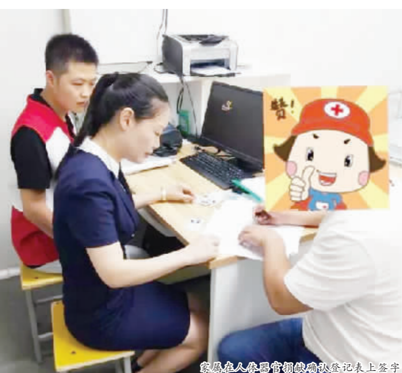
家属在人体器官捐献登记表上签字