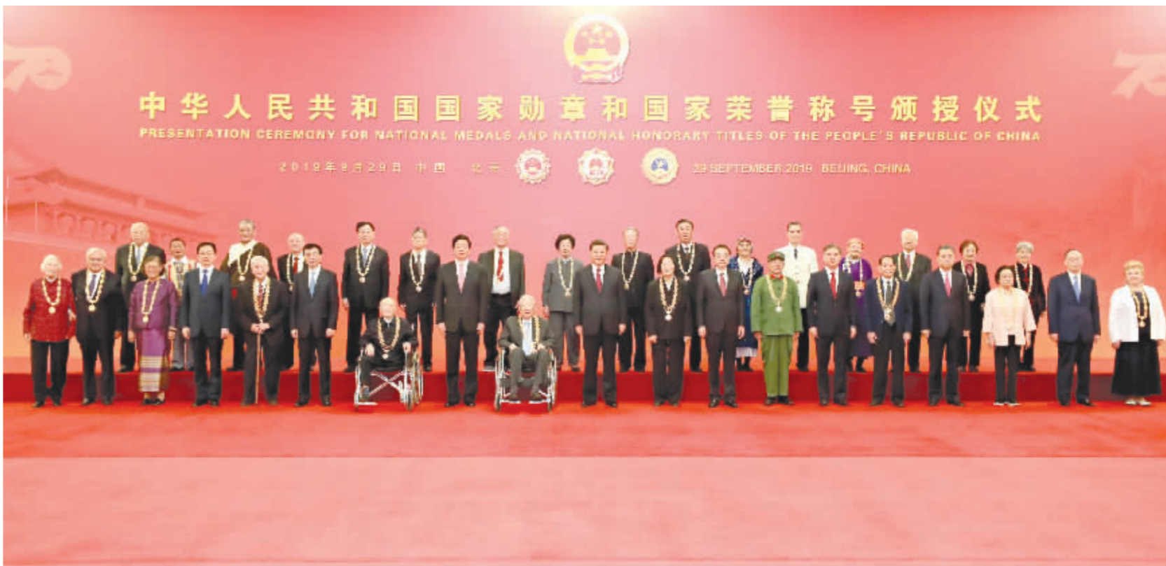
习近平等党和国家领导人同国家勋章和国家荣誉称号获得者合影。