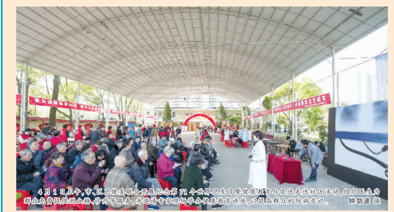
4月1日上午,市、区卫健委联合开展纪念第71个世界卫生日暨健康教育与促进先进社区活动,组织医生为群众免费提供测血糖、测视力等服务,并邀请专家现场举办健康教育讲座,以提高群众的防病意识。

广丰讯 春寒料峭的清晨,一位“清洁员”拿着扫帚扫过春昏晃晃,从远至近,将巷子打扫得焕然一新。 早起的居民发现,她居然是广丰区永丰街道东街社区支书郑小红。郑小红说:“平日里负责东街卫生的清洁工生病了,今天就由我来扫!” 这是永丰街道党员干部投身创卫的一个缩影。为推进创卫工作,营造人人动手、全民参与的浓厚氛围,永丰街道把创建国家卫生城市工作作为当前首要任务,充分发挥基层党组织的战斗堡垒和先锋模范作用,广泛动员党员积极参与、创卫,再掀创卫新高潮。同时,围绕督查重点,切中要害,迅速整改,补齐短板;加大排查力度,充分发挥社区网格员作用,逐项对照排查,做到立查立改;加大创卫工作督查力度,开展明察暗访,不定期通报情况,推动创卫工作深入开展。 “环境卫生靠大家,希望大家都能自觉讲文明、讲卫生,不乱丢垃圾。”在创卫包干区,党员干部郑宜强一手拿簸箕一手拿扫帚弯着腰仔细清扫,同时还边向行人和商户宣传。不远处,还有八、九名党员干部正在忙碌。他们有的用钩叉捡道路两旁的垃圾,有的清除墙上、灯杆上的小广告。日前,永丰街道各社区及区直责任单位按照创卫网格化管理责任分工,对所辖区域道路沿线、绿化带的生活垃圾进行全面清扫,并引导督促沿街商户自觉落实好“门前三包”责任制,努力营造干净、整洁、优美的生活环境。 (刘瑛 叶响)