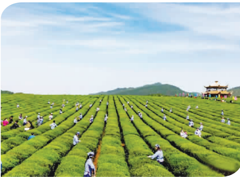
丰园苗木专业合作社