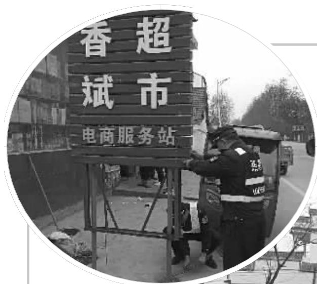
为进一步改善公路路况,保障道路安全畅通,近日,万年公路分局路政大队集中整顿、拆除多处违法广告牌、违法标志牌、跨路龙门架等违章建筑物,给过往行人提供了更优美、更安全舒适的路段环境。祝玉仙 杨琴 摄影报道

婺源、德兴、余干、鄱阳四个县市代表在会上作了发言。与会人员还现场参观了德兴市、婺源县两地公共文化服务相关设施。