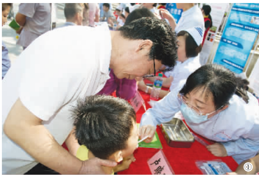
① 医生正在给小朋友检查口腔