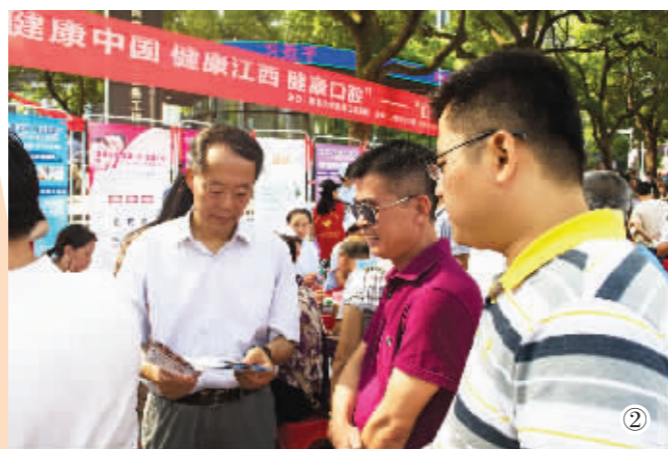
② 市民们正在阅读口腔保健资料