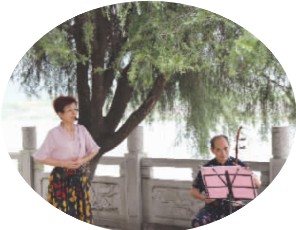
沿河路的清晨歌声悠扬

这座以出产青石著名的小城如今是“中国台球之都”“世界台球名城”。台球文化,在历史的发展中融入了这里的点滴。从当地人口中,我们了解到这里如今有200多家台球馆,台球是一项不论男女老幼都会接触的体育运动。在上世纪八九十年代,哪怕是小卖铺前都会摆上一张台球桌,几块钱就能打上一局。时光更迭,如今,人们可以在环境更好的台球馆里感受着这座小城的台球文化。