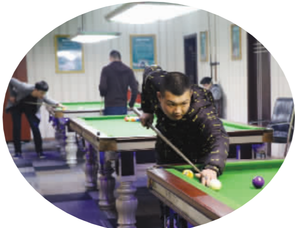
台球是古城居民喜爱的运动 吴德强摄