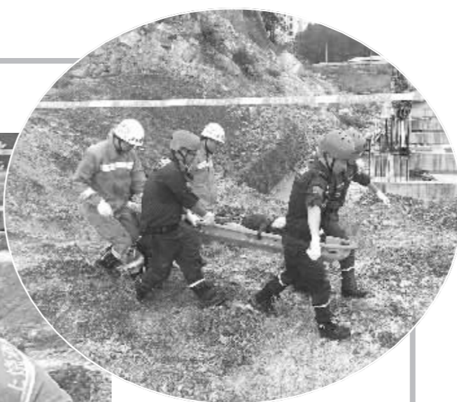
近日,万年县消防大队、人防办、应急办、县医院和蓝天救援队等部门联合,在汪家乡坑边村组织开展山体滑坡应急救援演练,以提升应急救援队伍的应急处置能力,切实增强实战经验。