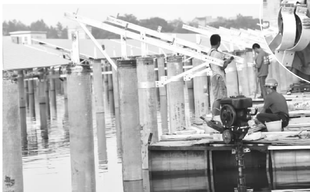
连日来,鄱阳县古县渡镇太平水库光伏发电现场施工工人冒高温、战酷暑,奋战在安装工地。据悉,该项目为该镇光伏扶贫项目,占用水面近千亩,于今年3月份开始施工。