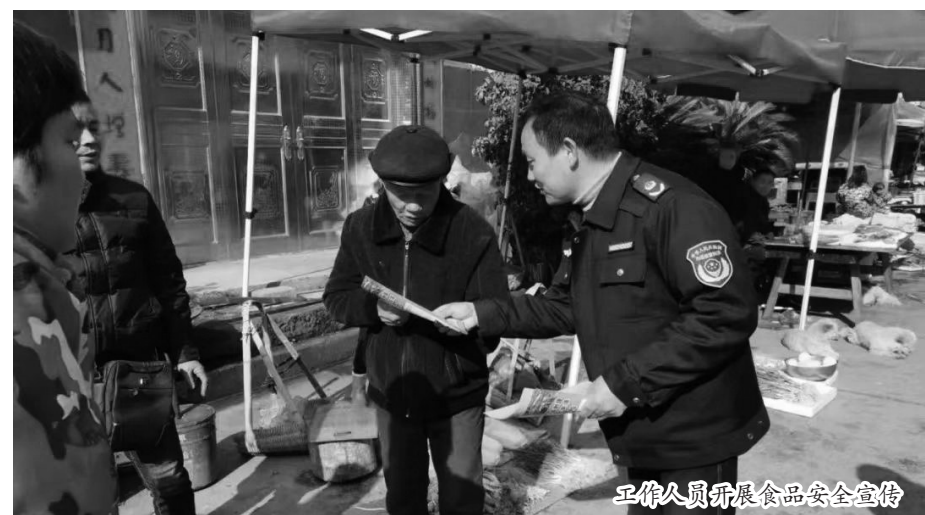
工作人员开展食品安全宣传

春季升温多雨,野菜生长旺盛,如果不加辨识,容易误食“毒草”。对此,市市场监督管理局发布食品安全提示:建议市民对路边不熟悉的野菜,不要随意采食,避免误食“毒野菜”。