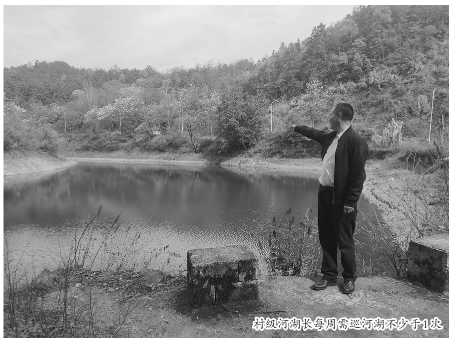
村级河湖长每周需巡河湖不少于1次