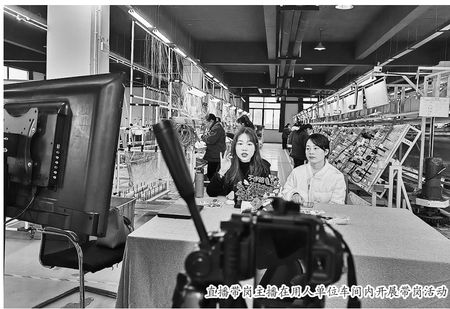
直播带岗主播在用人单位车间内开展带岗活动