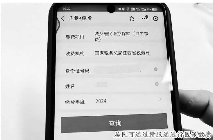
居民可通过赣服通进行医保缴费

市医保局特别提醒:不要跨险种重复参加居民医保和职工医保,在异地学习、工作、生活的人,请勿在异地和老家重复参保。