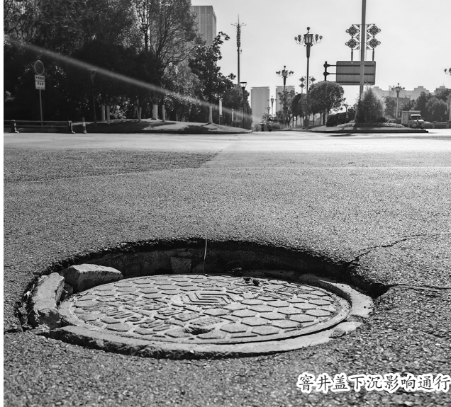
窨井盖下沉影响通行

在现场,记者注意到,下沉的井盖上标有“中国移动通信”等字样。于是,记者随即与中国移动通信相关工作人员进行了联系。对方了解相关情况表示,立即派人前往现场查勘,并马上处理此事,尽快消除隐患。16日上午,记者再次来到现场时,看到原先下沉的井盖已修复。