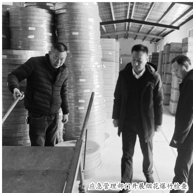
应急管理部门开展烟花爆竹检查

春节临近,不少市民的朋友圈、微信群出现了一些烟花爆竹的售卖消息。那么,在网络社交平台售卖烟花爆竹的行为合法吗?对此,市应急管理局提醒:烟花爆竹必须在合法的经营点销售,在微信群、朋友圈私自售卖烟花爆竹,不管有无销售许可证都涉嫌违法,并且一旦所销售的烟花爆竹出现问题,售卖方、转发者均要承担相关法律责任。此外,私家车后备箱“摆摊”和个人路边“摆摊”售卖烟花爆竹也是违法行为;非法渠道购买的烟花爆竹存在安全隐患。