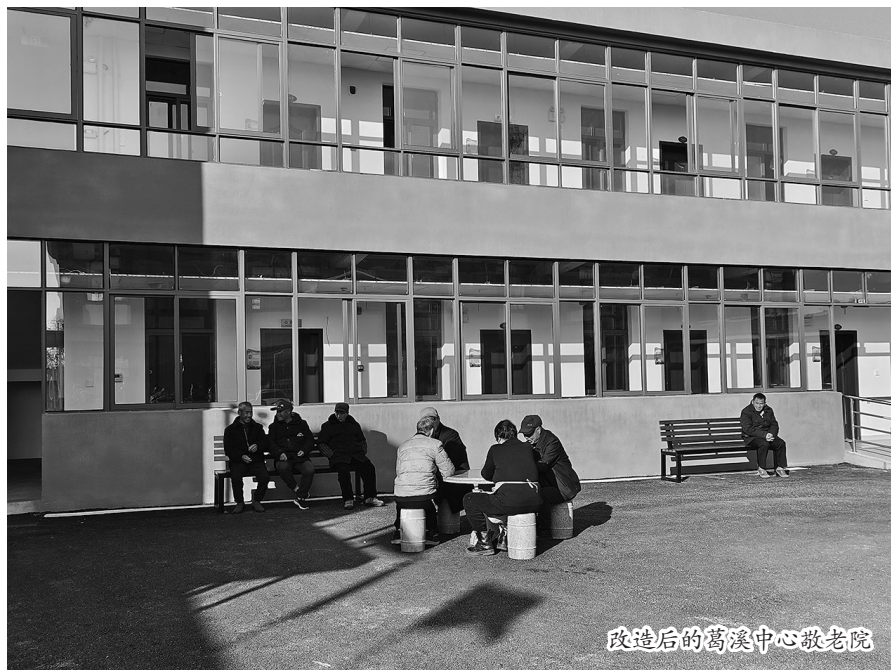
改造后的葛溪中心敬老院