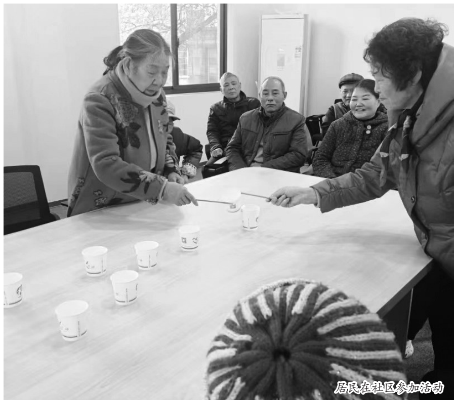
居民在社区参加活动