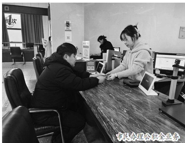
市民办理公积金业务

记者从市人社局获悉:社保卡“一卡通”将迎来新变化,不仅可以提取公积金,还支持读卡或扫码身份认证,持社保卡办事将更加高效便捷。日前,省住房和城乡建设厅、省人力资源和社会保障厅联合发布《关于推进社保卡居民服务“一卡通”在住房公积金领域应用的通知》(以下简称《通知》),要求各地要以打造凭卡办事和资金卡应用为重点,在6月底前实现社保卡在住房公积金领域的全面应用。