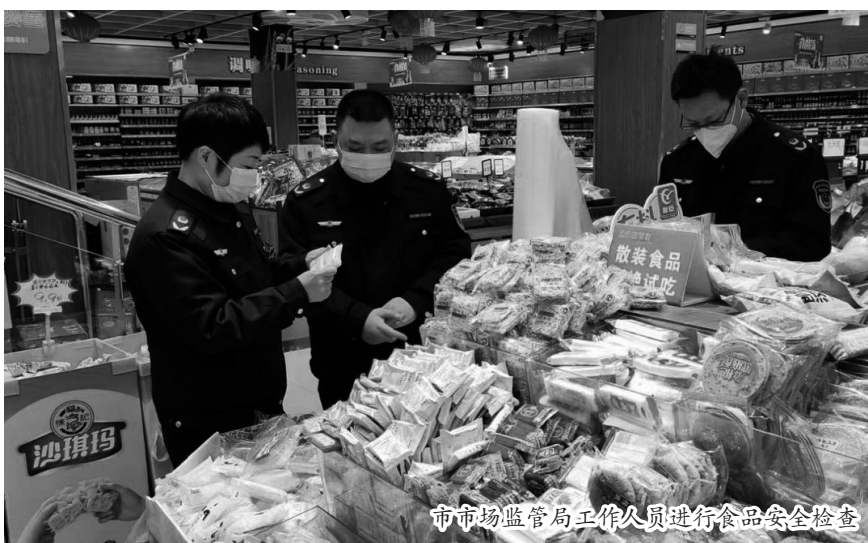
市场监管局工作人员进行食品安全检查

据介绍,下一步,市场监管局将每季度开展“你点我检,服务惠民生”活动,并以此项活动为契机,紧盯群众关心关切的米面粮油、肉禽蛋奶、瓜果蔬菜等重点食品领域,抽群众之所想、检群众之所盼,不断强化食品安全监管,规范食品生产经营,努力为群众营造放心、安全的食品消费环境。